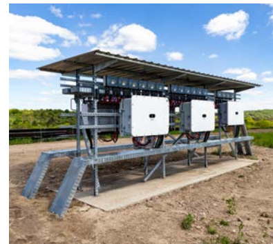
Gut be- dacht: Die Wechsel- richter

9.000 Solarmodule produzieren nicht nur Sonnenstrom, sie generieren für die Kommune auch Pacht- und Gewer- besteuerereinnahmen.